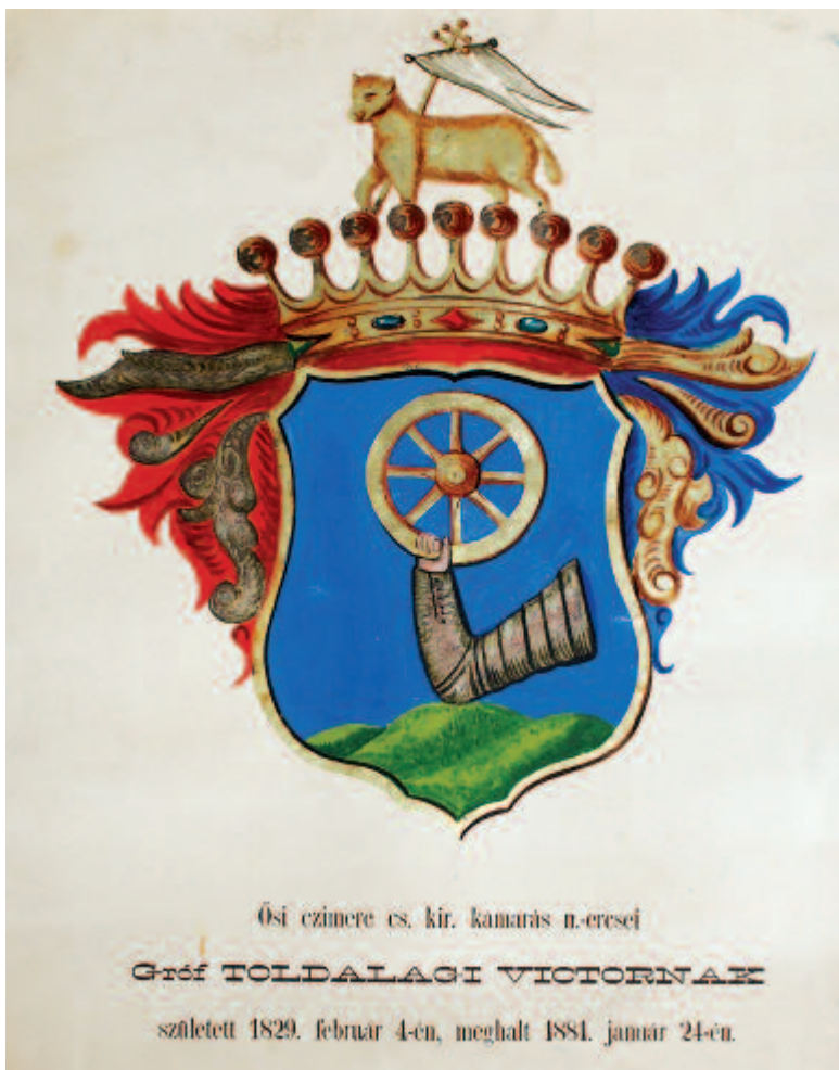
Nagyercsei Tholdalagi Victor (1829–1881) halotti címere. 66x50 cm méretű papírcímer

(összesen tíz címerrel) a Telekiek népes családjából származott, illetve többen is kötődtek hozzájuk házasság révén.