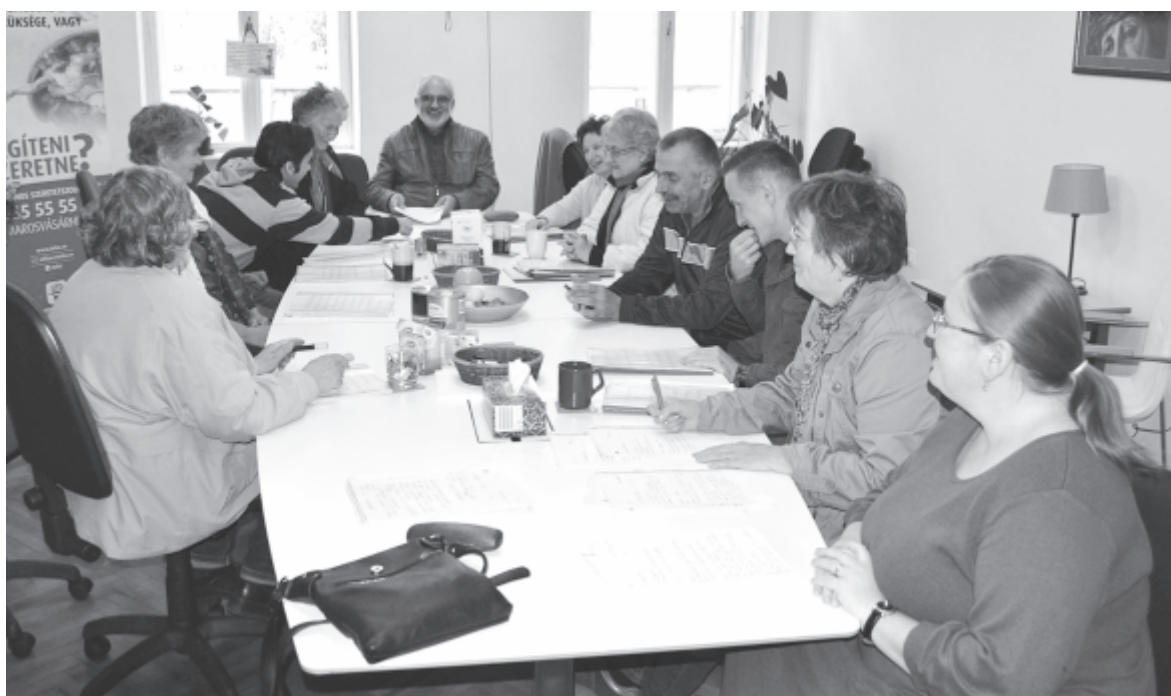
Tanácskozás a Telefonos Szeretetszolgálatnál

Sokan azt gondolják, hogy az önkéntesség az unatkozó háziasszonyok tevékenysége. Az önkéntesség a kutatások és a nemzetközi tapasztalatok szerint azonban sokkal szélesebb társadalmi rétegeket, különböző korosztályokat érinthet. A gyerekek szocializációja, oktatása, nevelése során fontos cél, hogy később közösségük aktív tagjaivá váljanak. Ezért kellene az önkéntes munkában rejlő lehetőségeket, a civil szervezetek tevékenységének fontosságát a törvényhozóinknak is felismerni és támogatni.