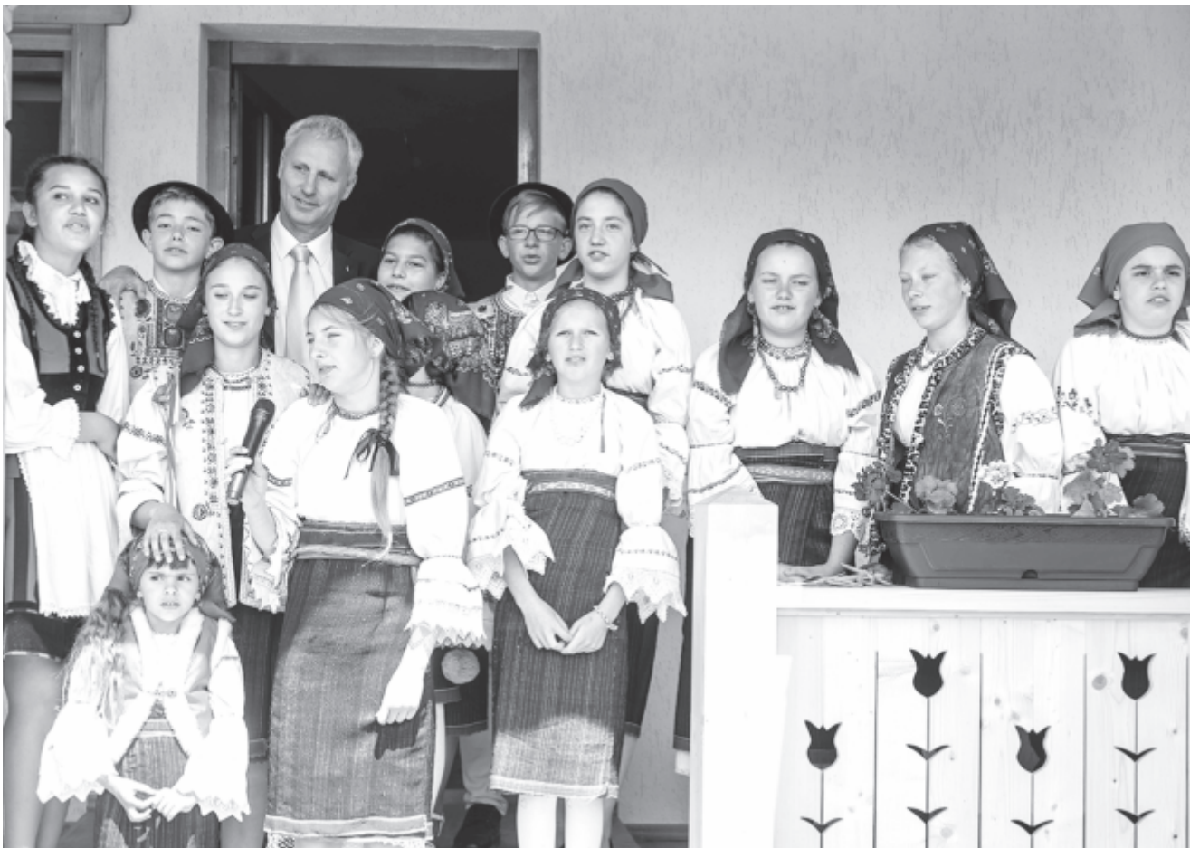
Soltész Miklós egyházi, nemzetiségi és civil társadalmi kapcsolatokért felelős államtitkár csángó népviseletbe öltözött fiatalok között a gyimesbükki plébánia-templom mellett, a magyar kormány támogatásával létesített közösségi ház avatásán.