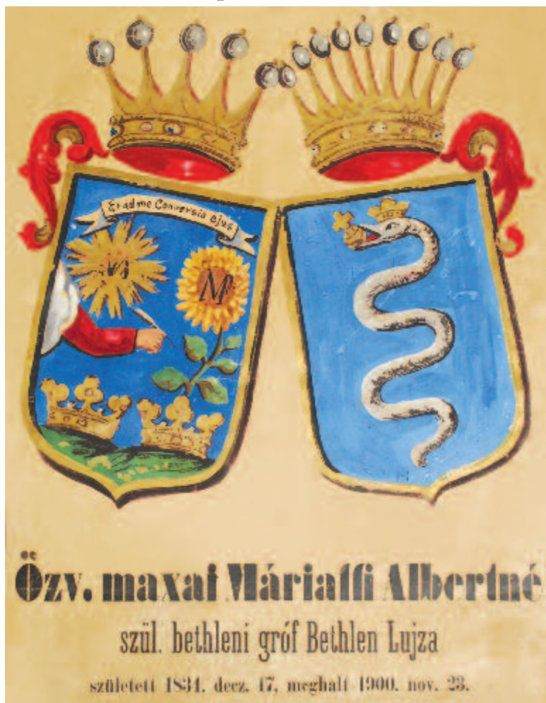
Bethleni Bethlen Lujza (1834–1900) halotti címere. 59x47 cm méretű papírcímer

Az erdélyi nemességet átszövő rokoni kapcsolatok a könyvtárban őrzött halotti címereken is felfedezhetők. A gyűjtők nyilvánvalóan elsősorban a hozzájuk közel álló személyekkel kapcsolatos dokumentumokat őrizték meg. Az elhunytak között is felfedezhetünk családi köteleket: négy személy