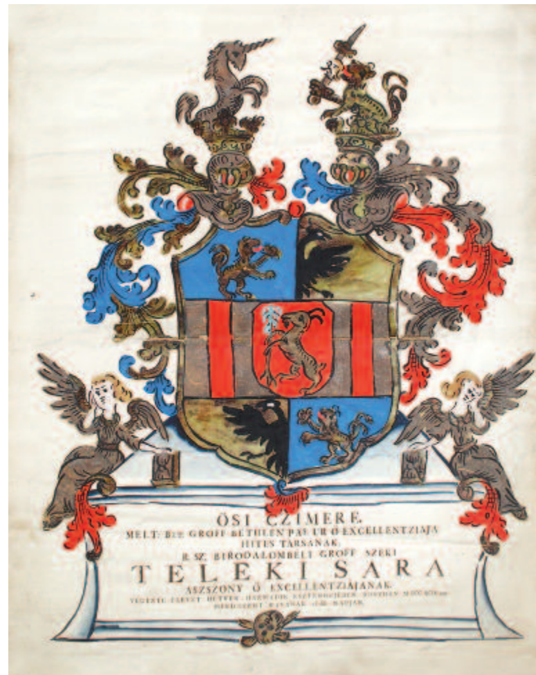
Széki Teleki Sára (1721–1794) halotti címere. 75x53 cm méretű papírcímer